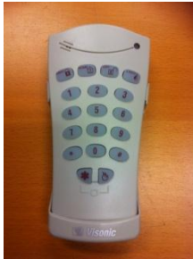
1: SH70/MP Manöverpanel

OBS! Är larmet kopplat till Securitas larmcentral, skall Du ringa 0771-50 60 75 och meddela om batteribyte. Larmcentralen lägger då larmet i serviceläge och ingen åtgärd vidtages.