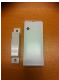
1: SH70/MK/PG2 Magnetkontakt

OBS! Är larmet kopplat till Securitas larmcentral, skall Du ringa 0771-50 60 75 och meddela om batteribyte. Larmcentralen lägger då larmet i serviceläge och ingen åtgärd vidtages.