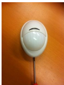
1: SH70/IR Rörelsedetektor

OBS! Är larmet kopplat till Securitas larmcentral, skall Du ringa 0771-50 60 75 och meddela om batteribyte. Larmcentralen lägger då larmet i serviceläge och ingen åtgärd vidtages.