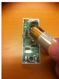
3: Plocka ur det gamla batteriet. Montera det nya batteriet. Var noga med att sätta batteriet pluspol mot mitten av kortet.