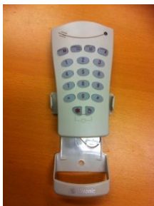
2: Lyft enheten ur hållaren på väggen genom att lyfta upp den. Batterifacket är på baksidan.

OBS! Är larmet kopplat till Securitas larmcentral, skall Du ringa 0771-50 60 75 och meddela om batteribyte. Larmcentralen lägger då larmet i serviceläge och ingen åtgärd vidtages.