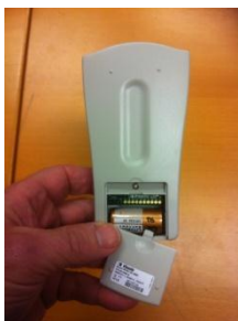
3: Luckan öppnas genom att skjutas nedåt.