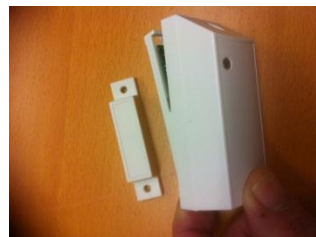
4: Sätta tillbaka locket. Börja med att föra tillbaka locket 45 grader vid stora fjädern och fäll försiktigt in mot plattan. Var noga med att fjädern inte kommer snett. Se efter så att lysdioden blinkar rött en gång när locket stängs. Håll det fjädrande locket inne och skruva fast med den lilla skruven. Lilla pilen på sidan mot magneten.